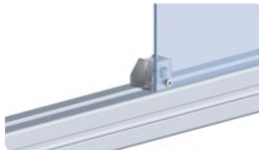
Uniblock, glasklar farblos Uniblock, Transparent Colorless